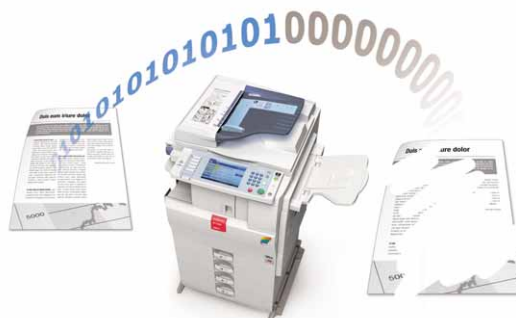
Sobreescritura de datos de disco duro

Las funciones de autenticación y encriptación protegen sus datos confidenciales. Además, las MP C2050/MP C2550 son compatibles con paquetes opcionales de seguridad como HDD Data Overwrite (Sobreescritura de datos de disco duro), Data Security for Copying (Seguridad de datos de copia), Card Authentication (Autenticación de tarjetas) y Secure Print Release (Liberación segura de impresión).