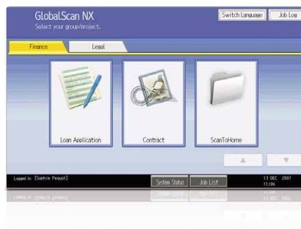
Interface gráfica de usuario sencilla y amena

Nuestro intuitivo sistema GlobalScan NX optimiza el flujo de trabajo del cliente al flexibilizar la distribución y el escaneo. Se pueden configurar iconos en los que preestablecer formatos de documentos y flujos de trabajo personalizados a través de una interface de usuario fácil de usar. Ya puede escanear en un solo paso desde el panel de mandos de las MP C2050/MP C2550.